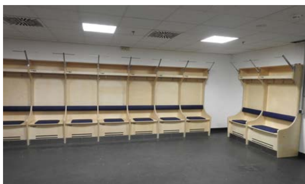
Skåpen färdigmonterade och klara i omklädningsrummet i Köln. Fyra-fem trailers transporterade skåpen ner till Tyskland.

Skåpen är på väg ut på den internationella scenen och kontakter finns med fotbollsklubbar i både England och Frankrike samt de största rugbyklubbarna i England. Redan i fjol levererades omklädnings-skåp till hockey-VM som då spelades i VTB-ispalatset i Moskva, en del av Park of